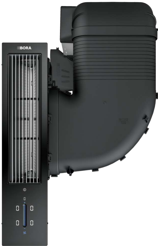
CKASE2 Classic 2.0 sett avtrekkssystem