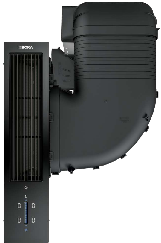
CKASE2AB Classic 2.0 sett avtrekkssystem All Black